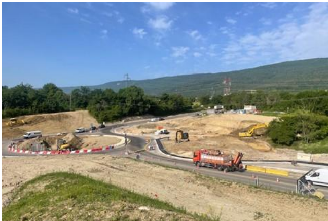
Diffuseur de Bellegarde/Valserhône

Depuis le lundi 28 août 2023, et durant un an et demi, des travaux sont réalisés au niveau du diffuseur n°10 de Bellegarde/Valserhône (A40). Les équipes remettent à neuf la gare de péage actuelle et créent une voie de sortie supplémentaire. Pour fluidifier le trafic et améliorer la sécurité, un giratoire est en cours de réalisation réalisé en partenariat avec le conseil départemental de l'Ain, en remplacement du STOP en sortie de péage.