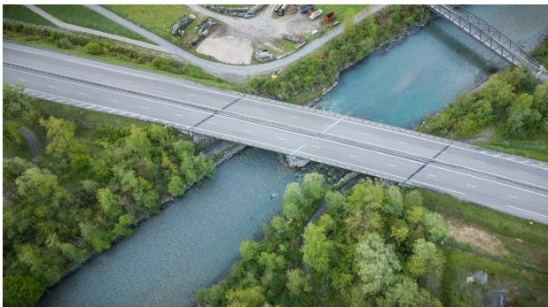
Pont autoroutier à Magland

Débutés le lundi 13 mai, des travaux de rénovation complète sont menés sur le pont autoroutier qui enjambe l'Arve au niveau de Magland (A40). Jusqu' au vendredi 4 octobre , les voies de circulation en direction de Chamonix seront fermées. Les conducteurs circuleront à double sens sur les voies de circulation en direction de Genève/Mâcon.